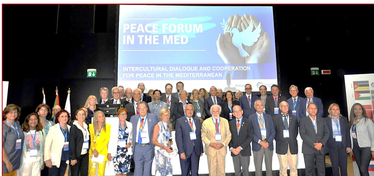
Conclusione del Forum. Foto di gruppo con alcuni dei partecipanti.

"Se vuoi veramente la Pace prepara la Pace"