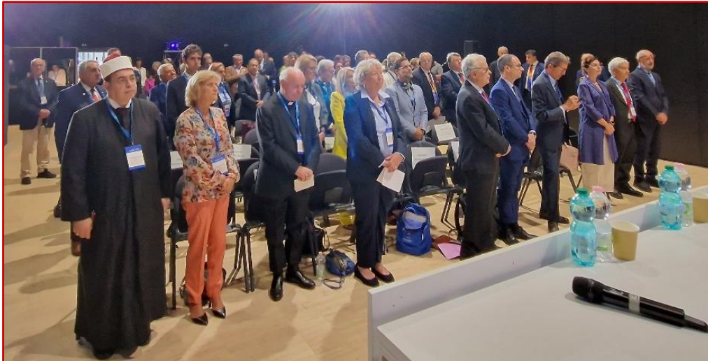
I partecipanti durante gli "Onori alle Bandiere"